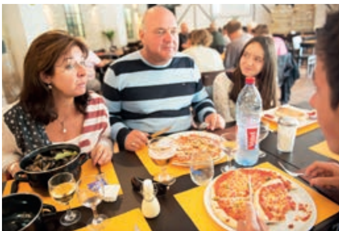
Salle de restauration pouvant contenir jusqu'à 100 personnes avec sono, piste de danse, écran géant, rétroprojecteurs, salle de billard...