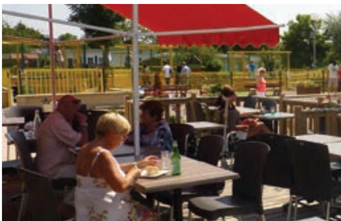
Vaste terrasse ombragée pour profiter des vos après-midis...